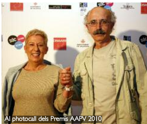
Al photocall dels Premis AAPV 2010