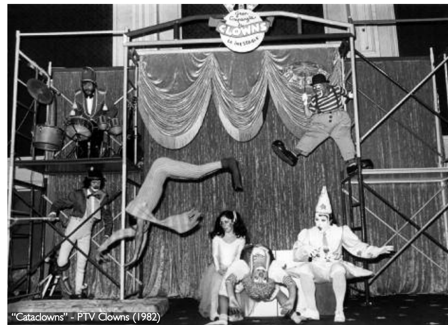
"Cataclowns" - PTV Clowns (1982)