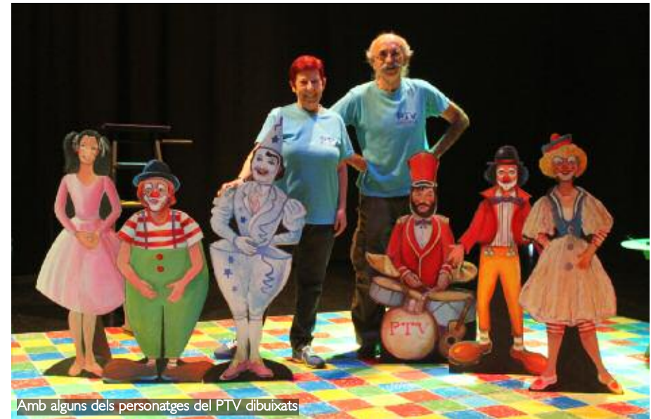
Amb alguns dels personatges del PTV dibuixats

Caldria temps per dir "a vore, el titular de què és PTV". Per a mi és el resum de més de mitja vida de treball, de viatges, d'afectes... No diré