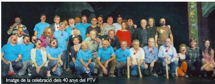
Imatge de la celebració dels 40 anys del PTV