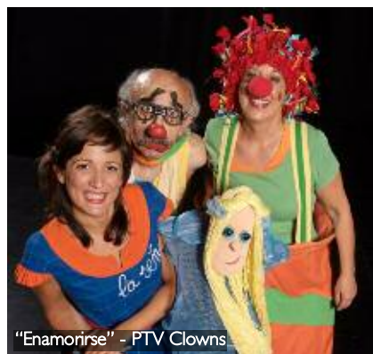
"Enamorarse" - PTV Clowns