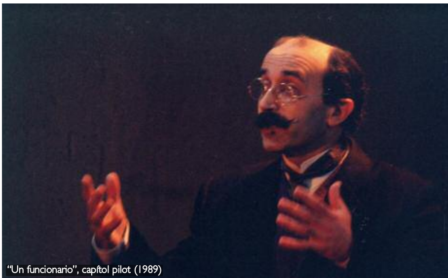
"Un funcionario", capítol pilot (1989)

segurament el nivell de depressió de la societat serà major ara. Dis-me com està el nivell social i et diré el nivell d'alegria. Però al mateix temps, hi ha gent que està enfadada sempre. Clar que, també hi ha gent que sempre sap mirar el costat positiu de les coses... El que importa és el nivell d'alegria de la societat, no els casos concrets.