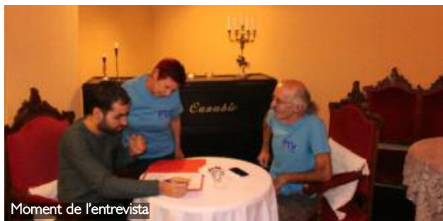
Moment de l'entrevista