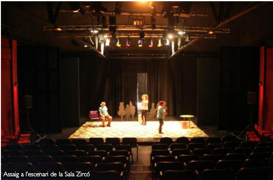
Assaig a l'escenari de la Sala Zircó