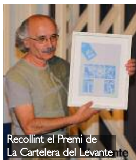
Recollint el Premi de La Cartelera del Levante