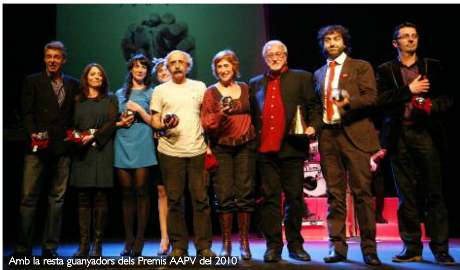
Amb la resta guanyadors dels Premis AAPV del 2010