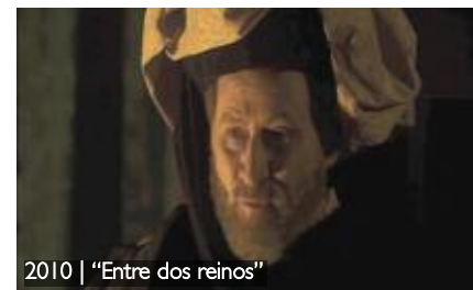
2010 | "Entre dos reinos"