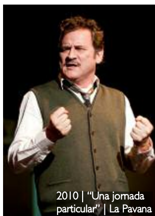
2010 | "Una jornada particular" | La Pavana