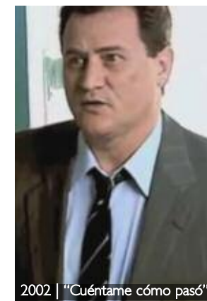
2002 | "Cuéntame cómo pasó"