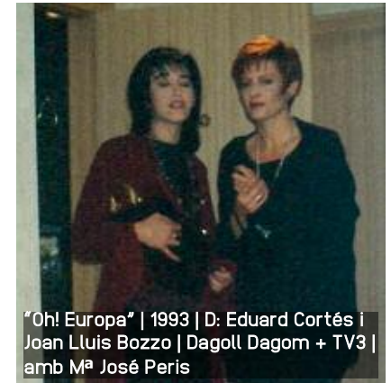
"Oh! Europa" | 1993 | D: Eduard Cortés i Joan Lluís Bozzo | Dagoll Dagom + TV3 | amb M a José Peris