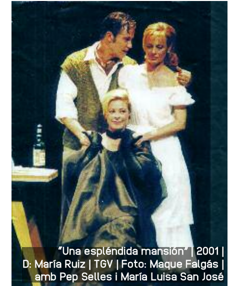
"Una espléndida mansión" | 2001 | D: María Ruiz | TGV | Foto: Maque Falgás | amb Pep Selles i María Luisa San José