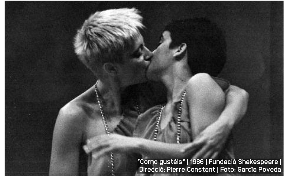
"Como gustéis" | 1986 | Fundació Shakespeare | Direcció: Pierre Constant | Foto: García Poveda

nerviós està de una hipersensibilitat molt forta... la tristesa que porte és que este món no m'agrada gens, va en picat. I com que tota la tonteria se't va a la porra. Molt trista perquè no podem ensenyar a les noves generacions quasi res, perquè les noves generacions pràcticament estan molt rebotades. I l'art està en la vida. Una cosa que se m'oblida dir quan vaig arregar el premi és dedicar-lo a les persones que com a mi la salut els ha posat en l'altre costat. I és que en l'altre costat, l'art continua perquè és molt fàcil que en teatre se't quede tot tancat. I que després arribes a casa i digues: "bah!", si no treballo tot el dia en açò, què faig? I l'art, m'he adonat que és portar allò quotidià a l'excels. La putada és que tu fas una obra i ha estat un dia molt bonic i un altre no tan bonic i ja està la ment-dement: "Ai". I ve algú a