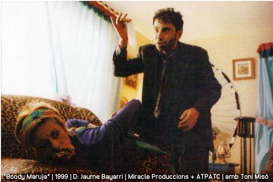
"Boody Maruja" | 1999 | D: Jaume Bayarri | Miracle Produccions + ATPATC | amb Toni Misó