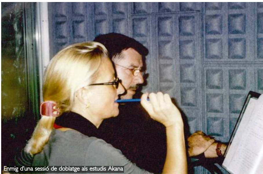
Enmig d'una sessió de doblatge als estudis Akana