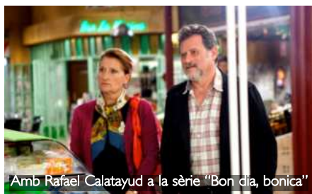
Amb Rafael Calatayud a la sèrie "Bon dia, bonica"