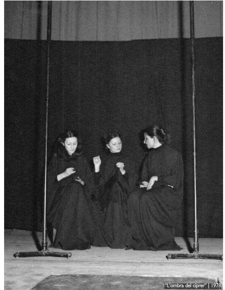
“L'ombra del ciprer” | 1978