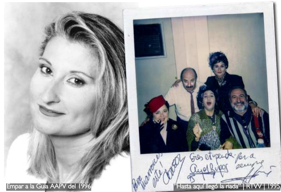
Empar a la Guia AAPV del 1996