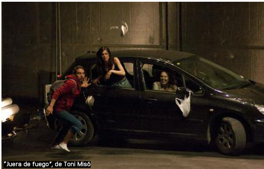
"Juera de fuego", de Toni Misó

L - És que si no, ací que vas a fer? Jo mentiria si diguera que no m'ho he plantejat. No me'n vull anar, tampoc, de València. València m'agrada, tinc la meua família, els meus amics... és una ciutat xicoteta... però és que al final et tiren fora, si no, ací que vas a fer? Malviure.