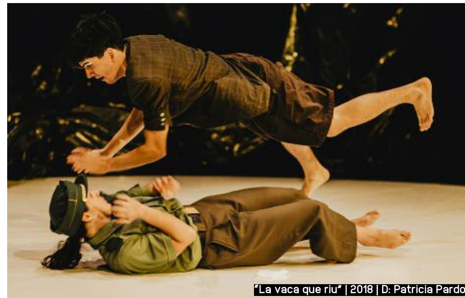
"La vaca que riu" | 2018 | D: Patricia Pardo

L - ...no, però sí que és de veres que si et donen alguna cosa... açò és com una relació de parella tòxica, que si et dóna alguna cosa sempre estàs ahí, ara que si no et dóna res... saps el que vull dir? Pense que és un poc així, si et donen unes miquetes, bé, doncs et quedes. Sempre tens esperança, perquè et donen esperança... però quan no veus res, com no tens res a perdre, dius: "Bé, doncs vaig a viure el món". Mentre tinguem alguna cosa ens quedarem.