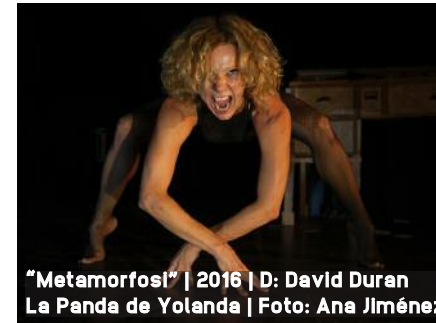
"Metamorfosi" | 2016 | D: David Duran La Panda de Yolanda | Foto: Ana Jiménez