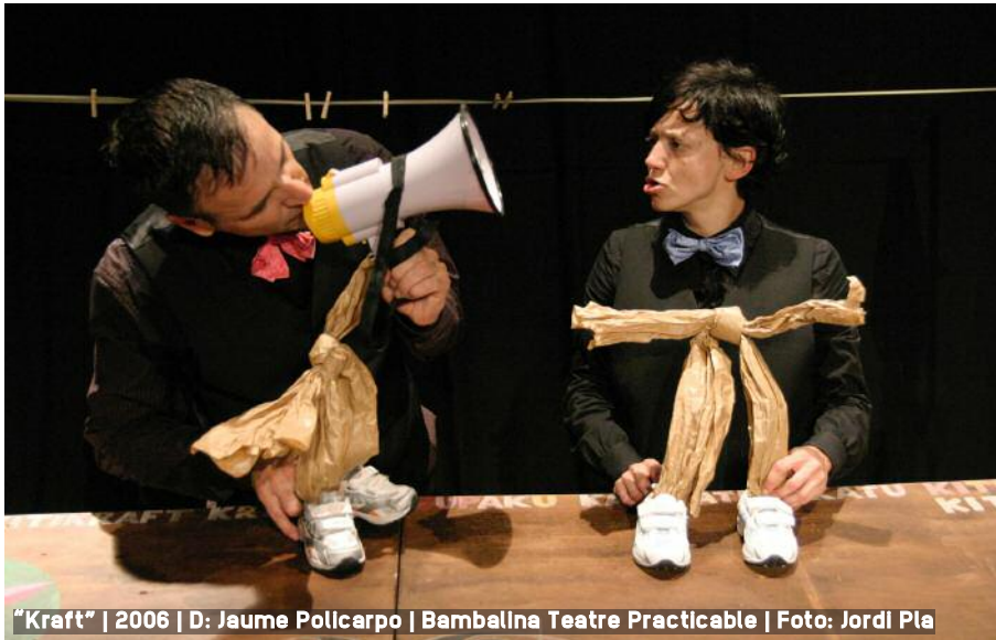
"Kraft" | 2006 | D: Jaume Pollicarpo | Bambalina Teatre Practicable