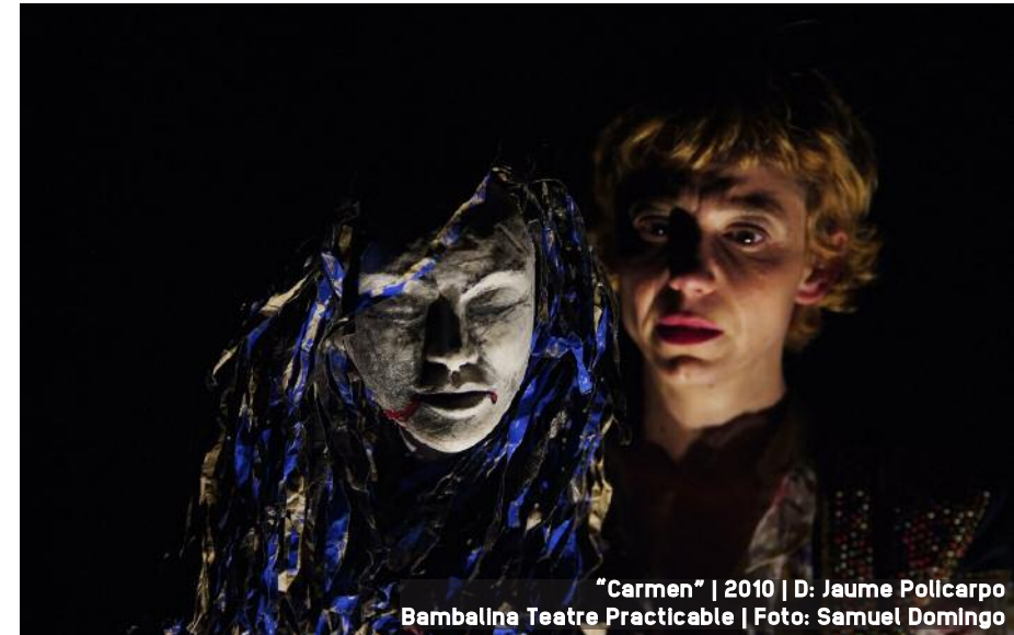
"Carmen" | 2010 | D: Jaume Pollicarpo Bambalina Teatre Practicable | Foto: Samuel Domingo

he cantat... coses molt variades, comèdies, drames, obres de dos o obres de huit. Està bé, t'ensenyas molt, m'agrada perquè he tocat tots els pals, fins i tot ballar... no sóc ballarina però sí tinc formació, vaig fer ballet molts anys, tinc una base de ball... i una base de kung fu, he fet moltes coses... o música... i en dansa sí que estava clavada en el conservatori i en la Royal, i tot això m'ho vaig haver de deixar en un moment perquè havia d'estudiar una carrera i no podia amb les dues coses però després m'ha servit tot. Per a ser actriu jo crec que et serveix tot. Tot és bagatge. Igual no puc ballar com una ballarina però sí puc fer-ho des de l'actriu. Tinc moltes nocions dins de mi que em serveixen per a ser versàtil, això sí que crec que ho tinc.