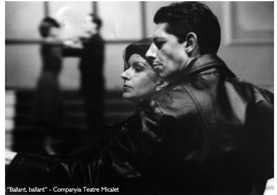
"Ballant, ballant" - Companyia Teatre Micalet