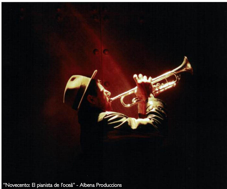
"Novecento: El pianista de l'oceà" - Albena Produccions

parla d'una cosa que em toca molt: l'amistat, un tema que és poc habitual en el teatre. I també perquè és una història plena de referències a la música, al jazz. I amb Ricardo Belda tocant el piano en directe... un luxe! La música em pot.