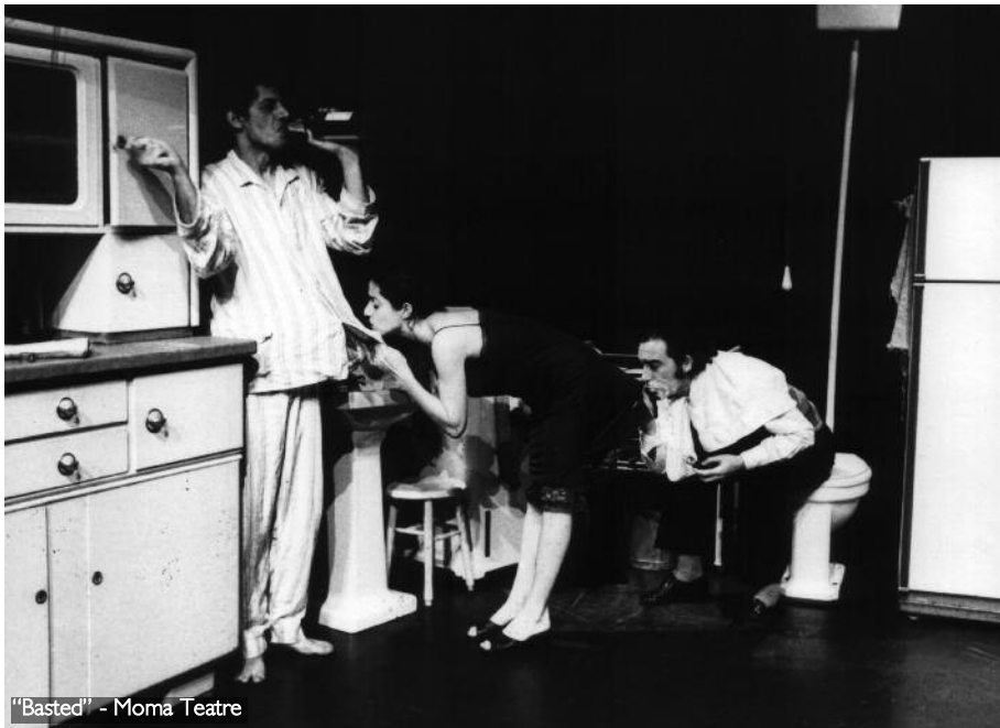
"Basted" - Moma Teatre