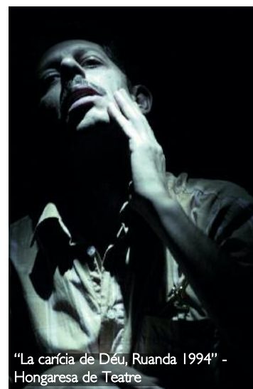
"La carícia de Déu, Ruanda 1994" - Hongaresa de Teatre