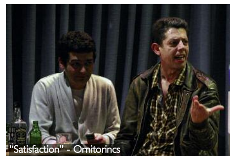
"Satisfaction" - Omitorincs