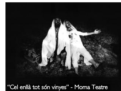
"Cel enllà tot són vinyes" - Moma Teatre