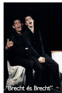
"Brecht és Brecht"

Si no pensara que podem aconseguir el creixement artístic del teatre valencià, m'hauria de dedicar a una altra cosa. Tinc eixe somni. Ara anem i aconseguim-ho!