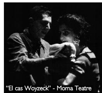
"El cas Woyzeck" - Moma Teatre